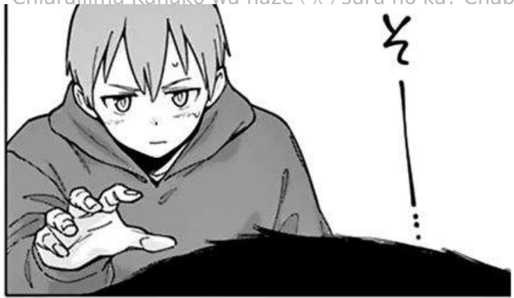
TL : SANGAT NYAMAN ~